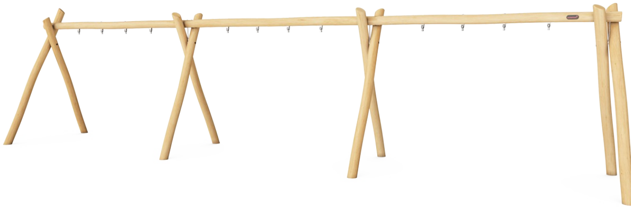
Keinurunko 6 istuimelle, korkeus 2,5 m.