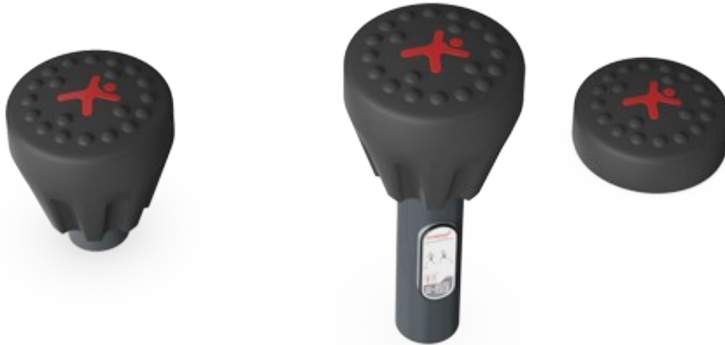
Jump Pod Set