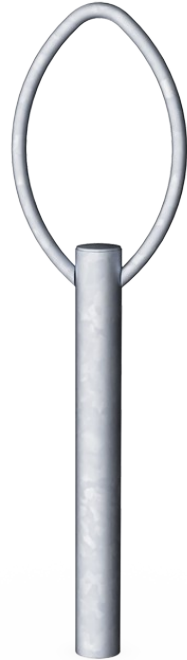
Polkupyöräteline, K: 85cm