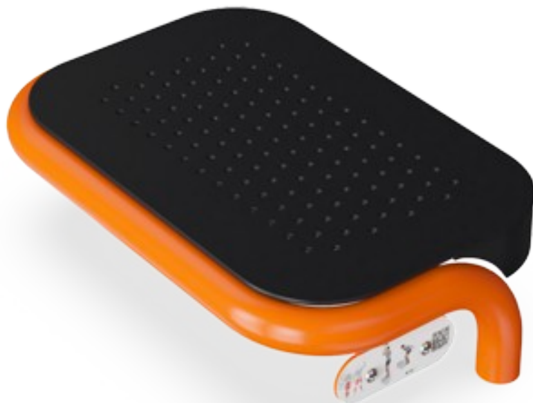
Stupátko, 20cm, z PU oceli - oranžové